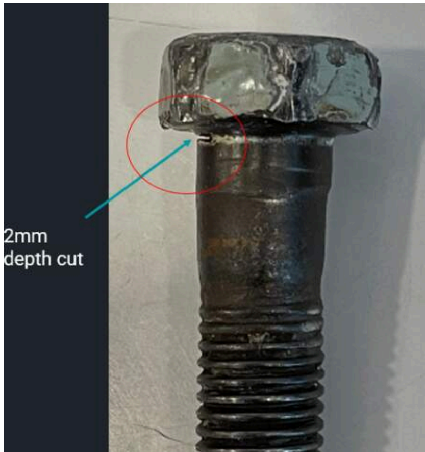
Bolt with a 2mm depth cut to simulate a defect.

Para este proyecto, se utilizó el detector de defectos Proceq_FD100 de Screening Eagle Technologies, que cuenta con capacidades de pruebas convencionales por ultrasonidos y phased array y muchas funciones para mejorar la eficiencia, como asistentes de calibración e informes automáticos. El detector de defectos UT8000 también podría utilizarse para este caso.