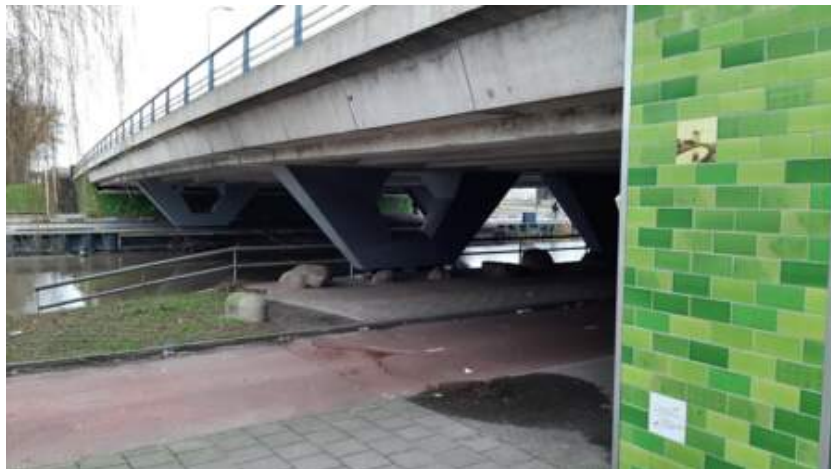
Side view of the bridge and drawings with indications of GPR data collection

El municipio de Utrecht quería rediseñar una carretera que contenía un pequeño puente, donde había que mover algunos postes de luz. El cliente de Screening Eagle, Ten Thije, fue contratado para comprobar si las nuevas ubicaciones de los postes de luz contenían refuerzo de pretensado.