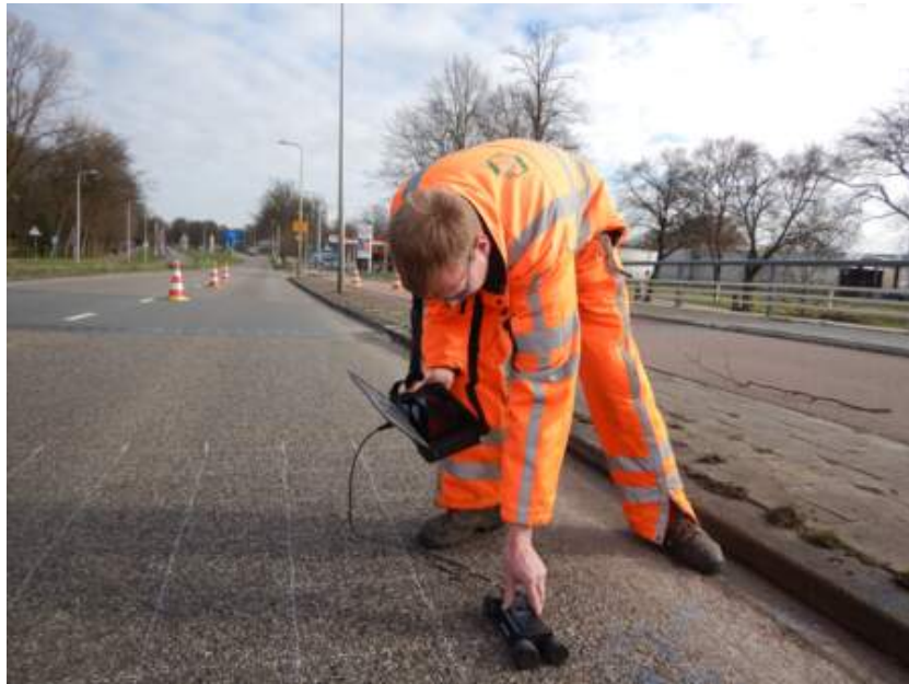
Using the Profometer on the bridge

La parte crucial de una investigación sobre un puente es el tiempo limitado que se tiene para trabajar en el lugar. Limitar el tráfico o cerrar el puente suele costar dinero al administrador del puente, por lo que el GPR es un método conveniente, ya que recoge datos rápidamente, sin causar ningún daño al puente.