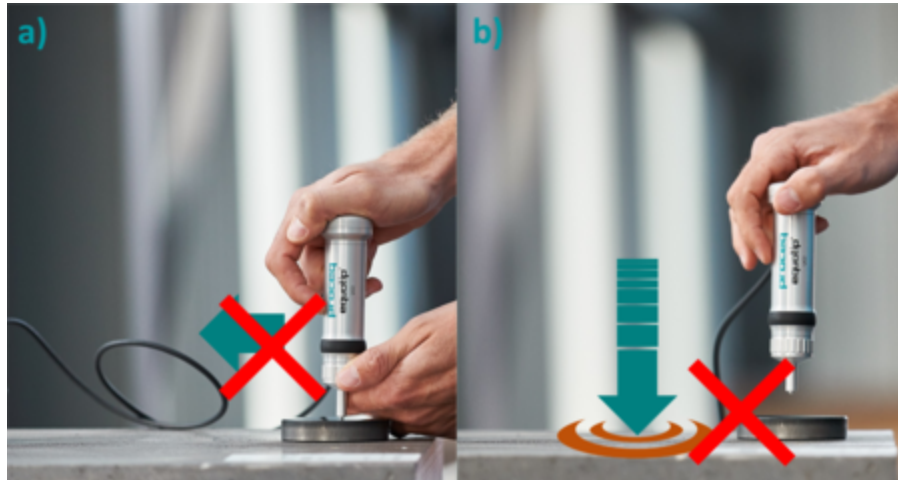
Figure.2. Schematic illustrations of potential probe applications that may lead to damage of the indenter. a) Lateral movements of the probe during the indentation. b) strong impact of the p

l'impact sur la surface de la pièce d'essai avec l'élan (figure 2.b) au lieu d'une pénétration lente et contrôlée du matériau peuvent provoquer des fractures et l'usure du diamant. Le mouvement du palpeur doit toujours être contrôlé avec les deux mains.