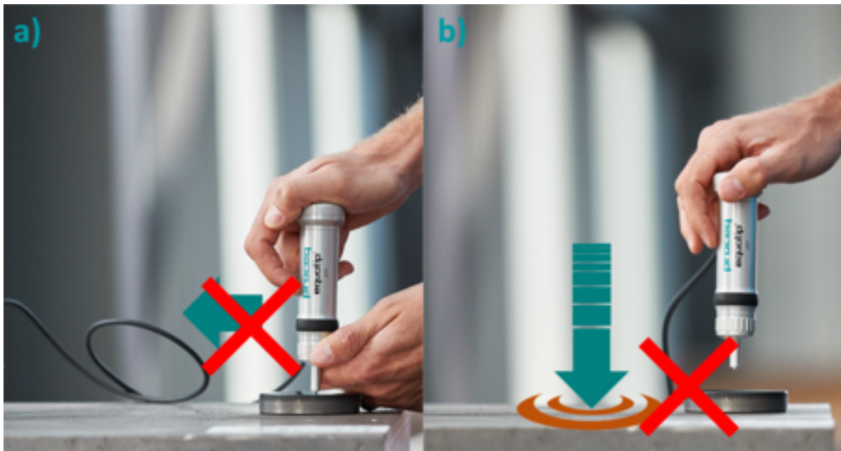
Figure.2. Schematic illustrations of potential probe applications that may lead to damage of the indenter. a) Lateral movements of the probe during the indentation. b) strong impact of the p