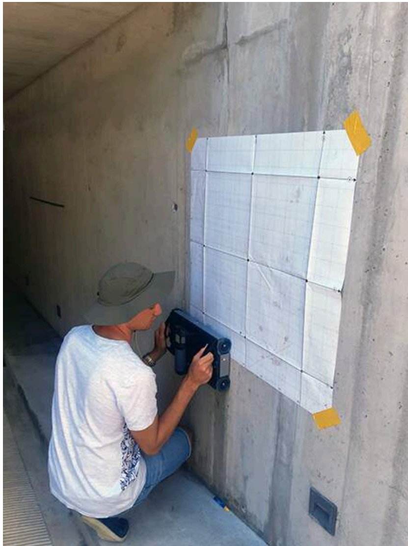
Using the GP8100 to collect an area scan