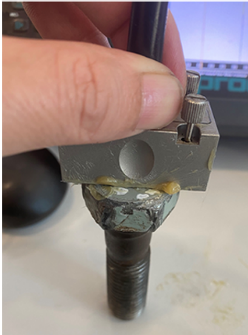
Phased array probe being held on a bolt. The bolt is ex-situ for the 'proof of concept' project but an identical testing method can be used with the bolt in-situ

Pour tester la solution proposée, un défaut a été simulé par une coupure de 2 mm, juste sous la tête du boulon. Le test par réseau phasé a été utilisé pour obtenir des images des deux boulons - l'un sans coupure et l'autre avec la coupure de 2 mm. Les images permettent d'identifier le filetage et la base du boulon. Dans le boulon coupé à 2 mm, une indication supplémentaire est visible à partir de la coupe de 2 mm. D'autres tests ont été effectués et il a été conclu que la technologie des réseaux d'ultrasons est une approche appropriée pour tester et condamner les boulons sur site.