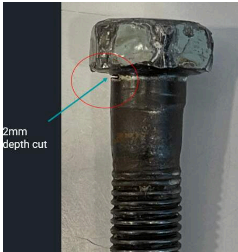
Bolt with a 2mm depth cut to simulate a defect.

Pour ce projet, le détecteur de défauts Screening Eagle Technologies Proceq FD100 a été utilisé. Il possède des capacités de test ultrasonique et de test par réseau phasé classiques, ainsi que de nombreuses fonctionnalités permettant d'améliorer l'efficacité, telles que des assistants d'étalonnage et des rapports automatiques. Le détecteur de défauts UT8000 pourrait également être utilisé pour ce cas d'utilisation.