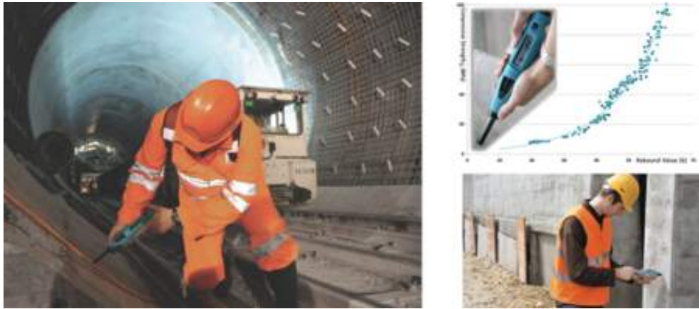
Next generation rebound hammer for concrete, the Silver Schmidt

2007 - Proceq lancia il martello a rimbalzo per calcestruzzo NDT di nuova generazione, Silver Schmidt , per le prove di resistenza alla compressione del calcestruzzo.