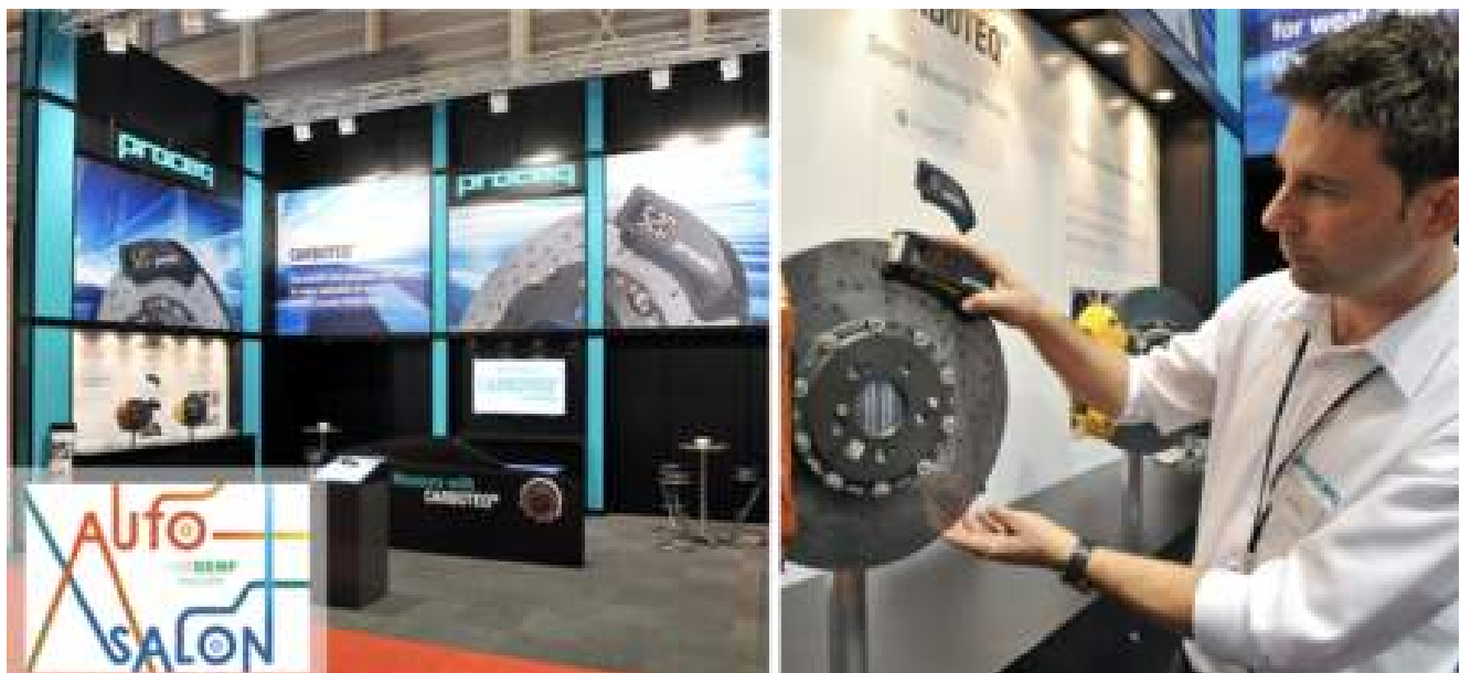
Carboteq carbon ceramic brake disc wear tester

2014 - Proceq ha introdotto il martello a rimbalzo Rock Schmidt specifico per le prove su roccia. L'azienda ha inoltre fornito un'altra soluzione a un problema crescente con il lancio di Carboteq, l'unico dispositivo portatile al mondo per misurare l'usura dei dischi freno in carbonio ceramico.