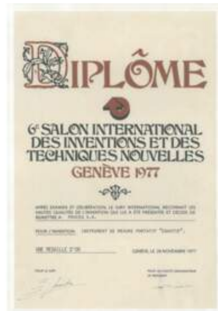
Equotip receives its first official recognition in 1977

Anni '80 - Questo è stato un decennio importante per il rilevamento delle armature e la valutazione del copriferro, in quanto Proceq ha lanciato sul mercato con grande successo i primi localizzatori di armature e copriferri Profometer .