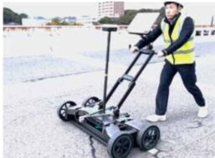
Figure 2 and Figure 3 show the GS9000 system operating on the bridge deck