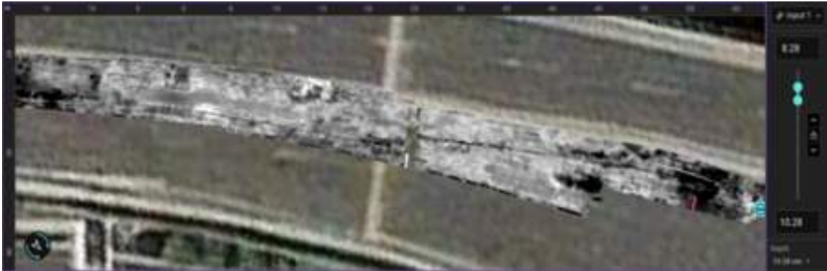
沥青混凝土 (A/C) 层之间的界面缺陷 (分层)