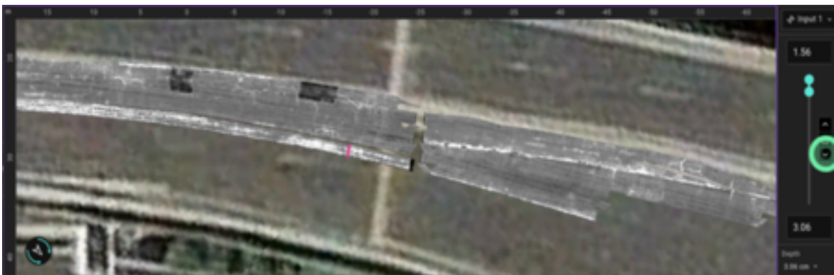
沥青层的主要表面缺陷（裂缝）

GPR 探测结果最重要的输出是劣化图，红色区域为劣化可能性区域，它是基于顶部钢筋的振幅衰减得出，符合 ASTM D6087 标准。