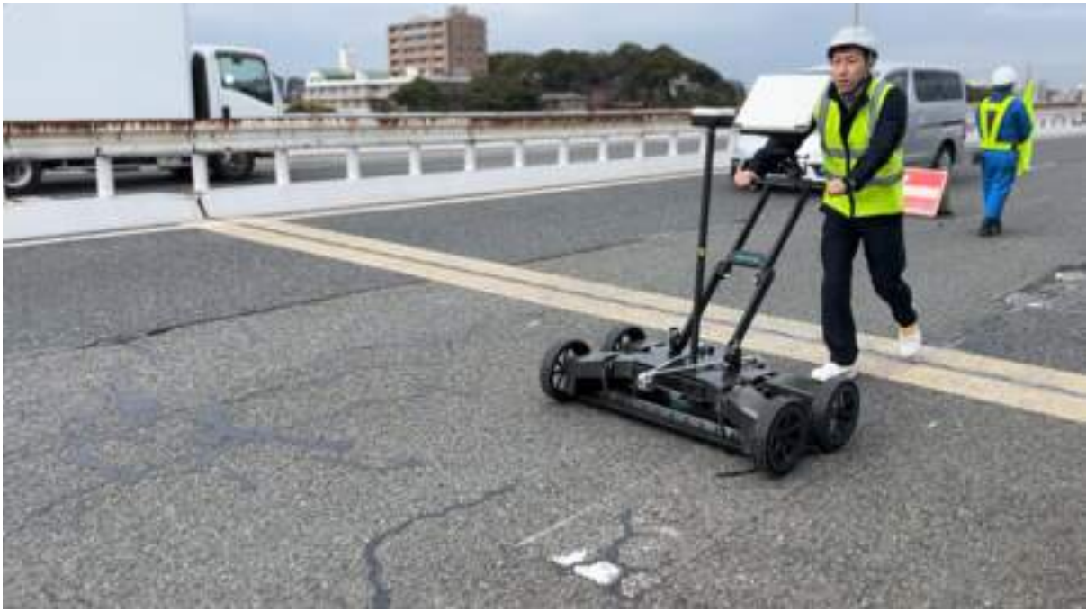
工作人员正推着GS9000探地雷达在桥面上进行探测