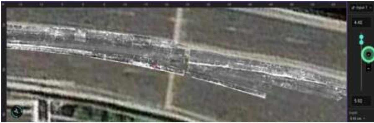
在沥青层内 4 至 6 cm深处发现了延伸的表层缺陷