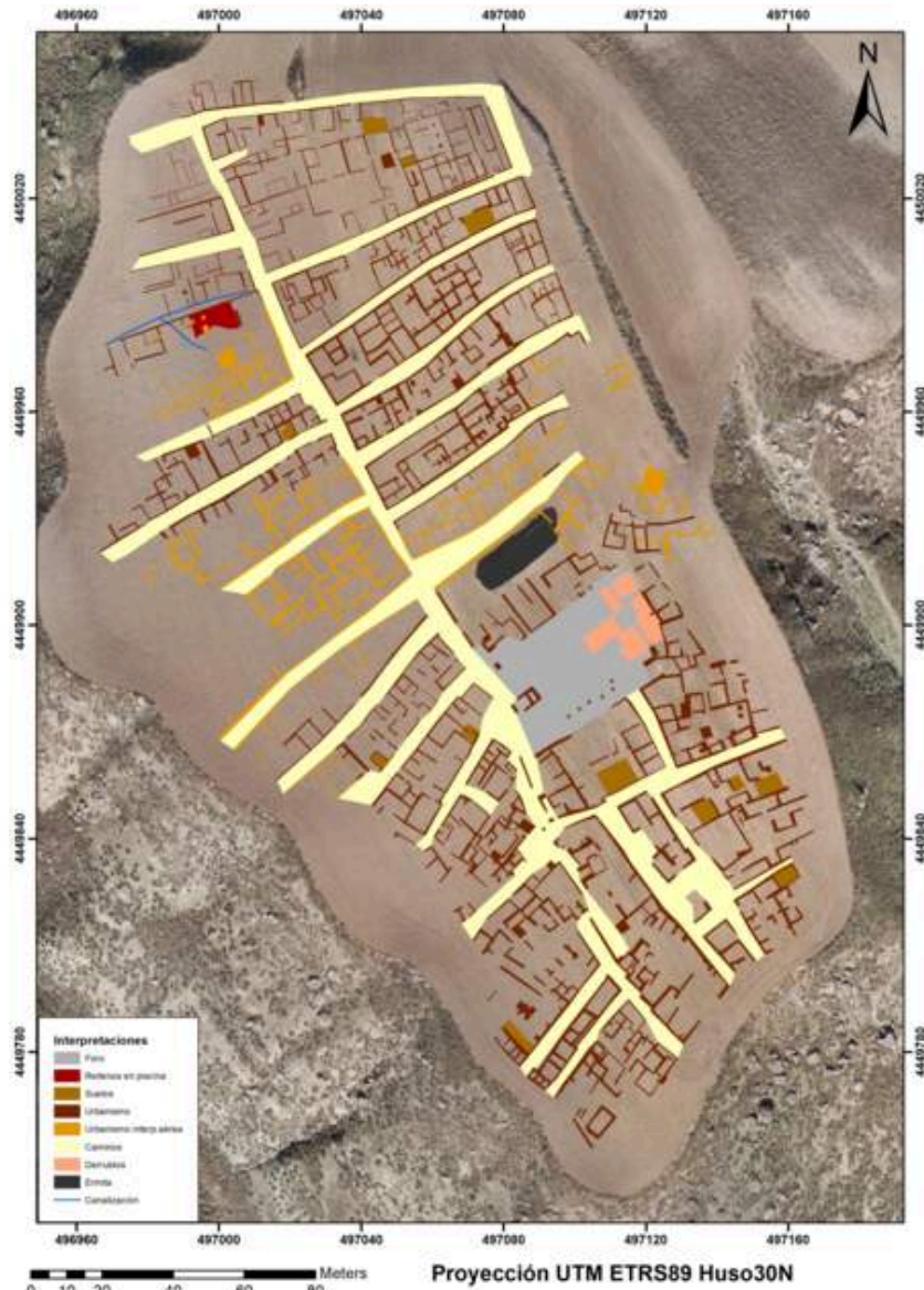
Figure 3. Map of interpretations of results on orthophotography (CAI of Archaeometry and Archaeological Analysis of the U. C. M.).

在场地的其余部分，探测到建筑结构和街道的区域，在不同深度的切片中，用红色标记振幅异常（图2）。探测到了无数不同类型和厚度的墙壁。在三维区块的切片视图中，实际上检测到了具有矩形形态的水平反射，它们对应的是铺设区或镶嵌型土壤，当呈现出介质的变化时，会在探地雷达轨迹中产生反射波峰（图1，A和B部分）。